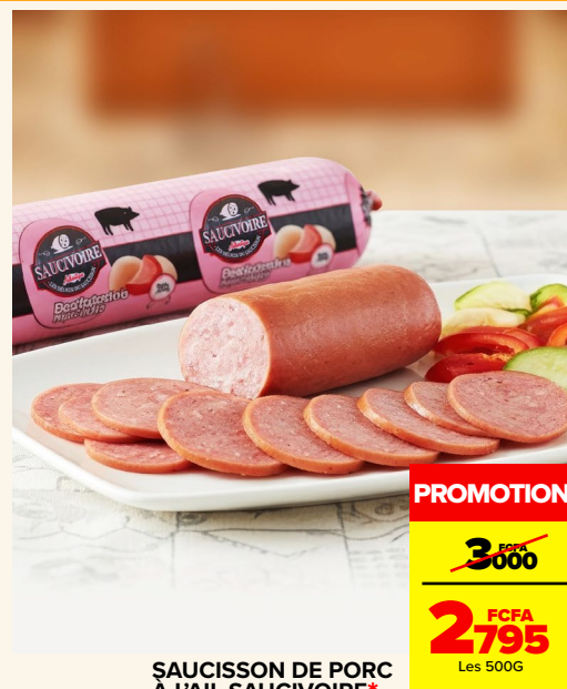
SAUCISSON DE PORC À L'AIL SAUCIVOIRE*