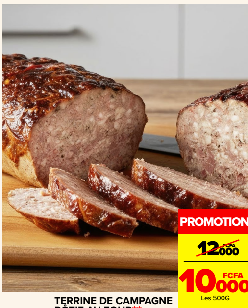
TERRINE DE CAMPAGNE RÔTIE AU FOUR**