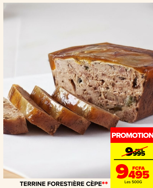
TERRINE FORESTIÈRE CÈPE**

L'ABUS D'ALCOOL EST DANGEREUX POUR LA SANTÉ. À CONSOMMER AVEC MODÉRATION.