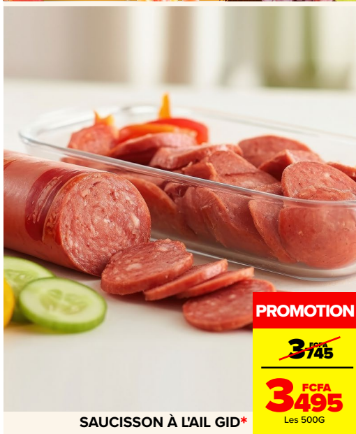
SAUCISSON À L'AIL GID*