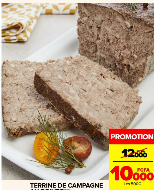
TERRINE DE CAMPAGNE AU POIVRE**