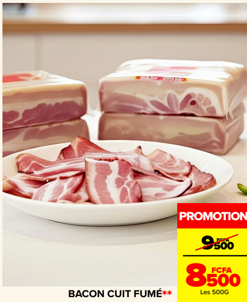
BACON CUIT FUMÉ**