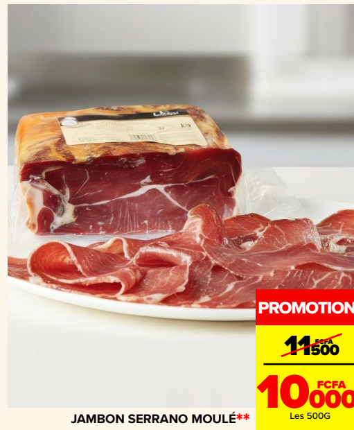
JAMBON SERRANO MOULÉ**