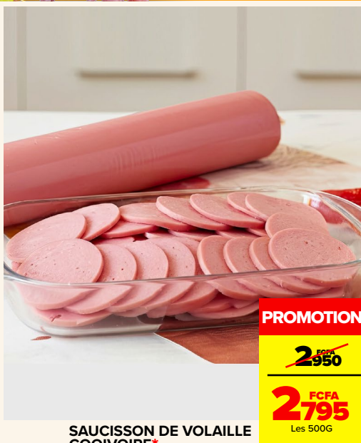
SAUCISSON DE VOLAILLE COQIVOIRE*