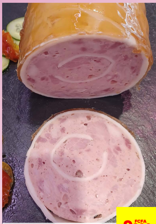
BALLOTINE DE VOLAILLE