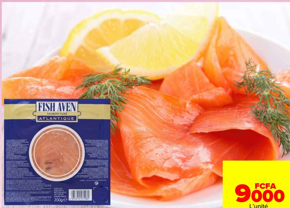
SAUMON FUMÉ 200G FISH AVEN