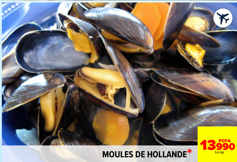
MOULES DE HOLLANDE*