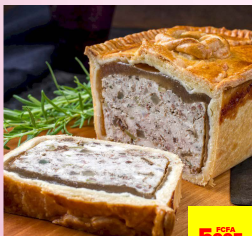
PÂTÉ EN CROÛTE*