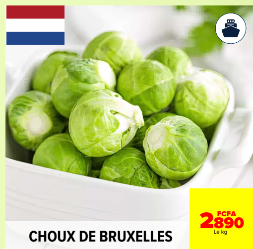
CHOUX DE BRUXELLES