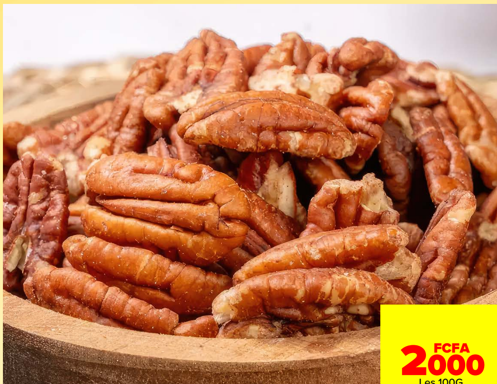
NOIX DE PECAN