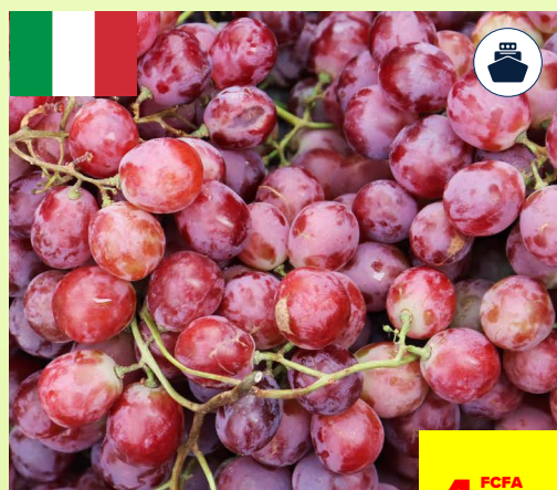
RAISINS RED GLOBE