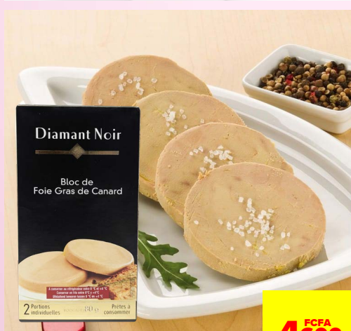
BLOC DE FOIE GRAS DE CANARD 80G DIAMANT NOIR