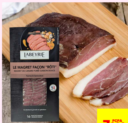
LE MAGRET DE CANARD FUMÉ 16 TRANCHES LABEYRIE