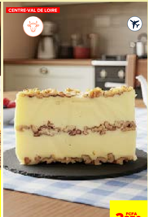
BÛCHE FONDUE AUX NOIX**