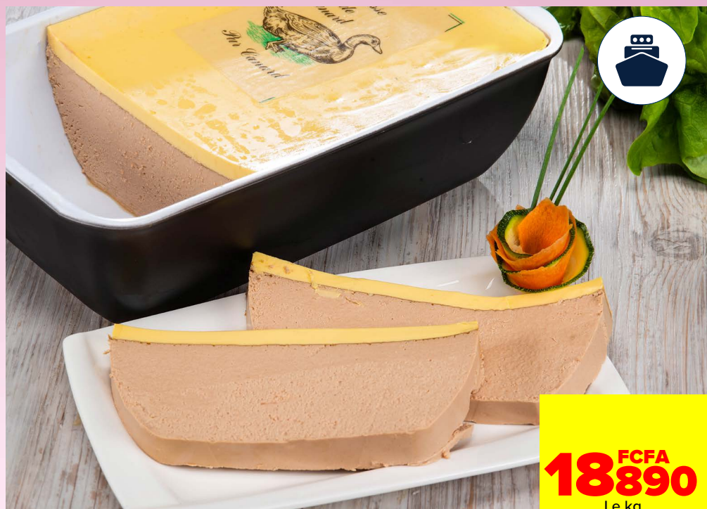
TERRINE MOUSSE DE CANARD