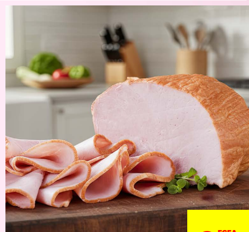
JAMBON DE DINDE FUMÉ