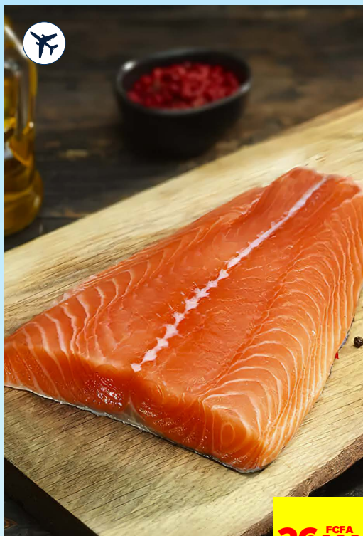
FILET DE SAUMON FRAIS*