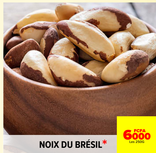
NOIX DU BRÉSIL*