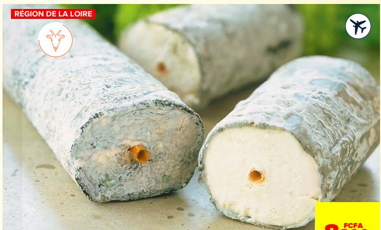
SAINT-MAURE DE TOURAINE JACQUIN**