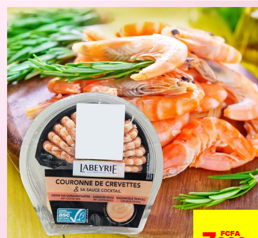
COURONNE DE CREVETTES & SA SAUCE COCKTAIL 130G LABEYRIE