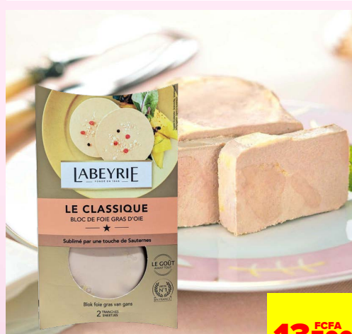
BLOC DE FOIE GRAS D'OIE 80G LABEYRIE