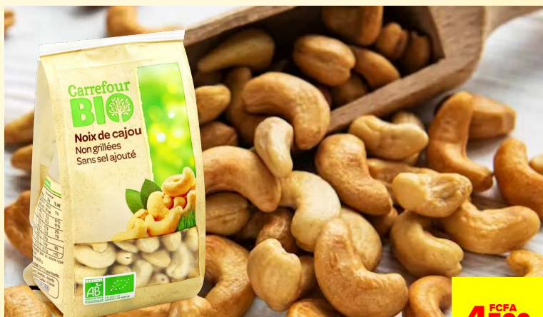
NOIX DE CAJOU CRUES CARREFOUR BIO**