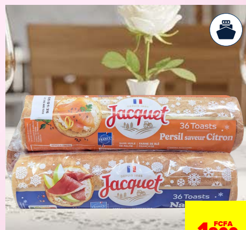
PAIN TOASTS X36