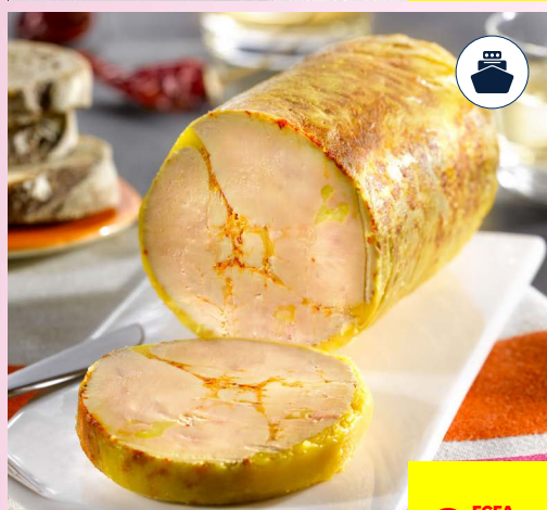
FOIE GRAS DE CANARD MI-CUIT ENTIER