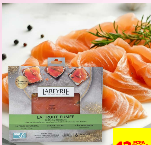
LA TRUITE FMÉE 8 TRANCHES 180G LABEYRIE