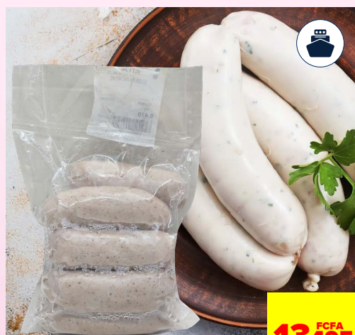
BALLOTINE DE VOLAILLE