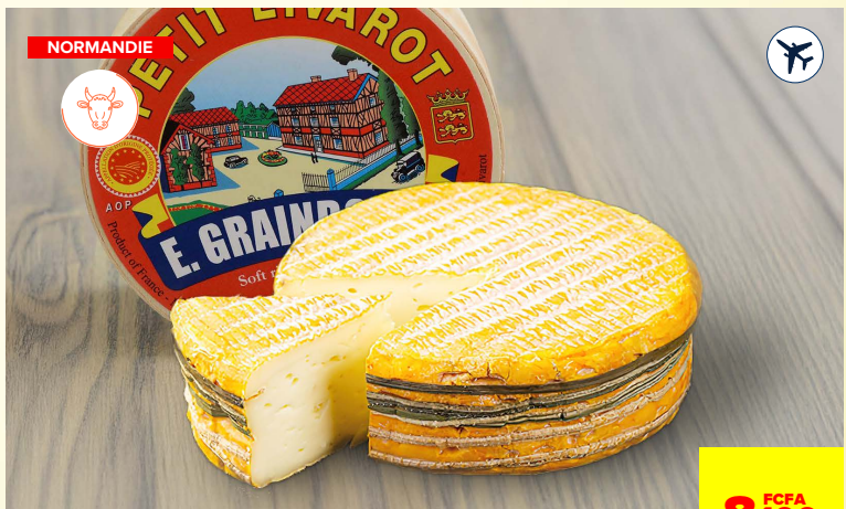
PETIT LIVAROT GRAINDORGE**