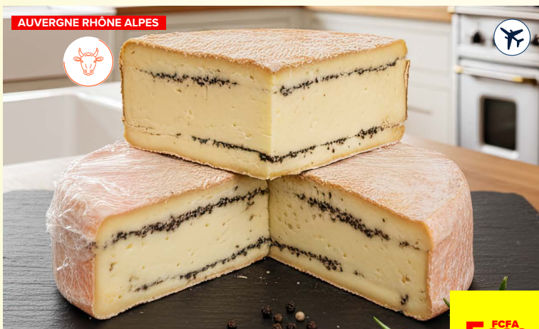
MOELLEUX DU REVARDE TRUFFES**