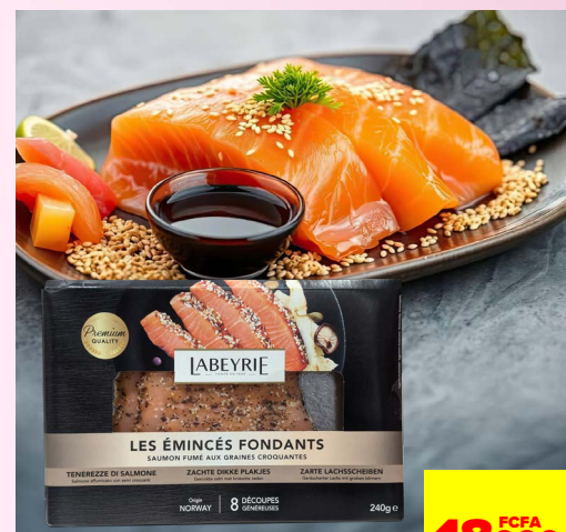
SAUMON FUMÉ AUX GRAINES CROQUANTES LABEYRIE