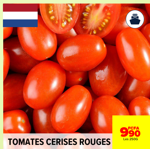
TOMATES CERISES ROUGES