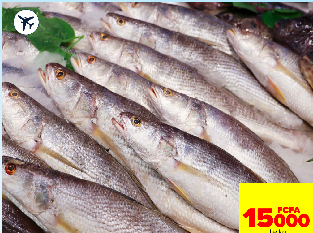
BAR ENTIER 400/600G