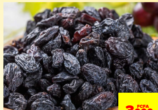
RAISINS NOIRS SECS