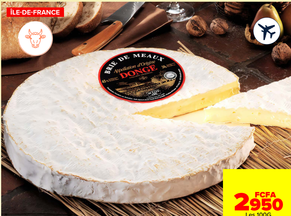
BRIE DE MEAUX DONGE PAILLE**