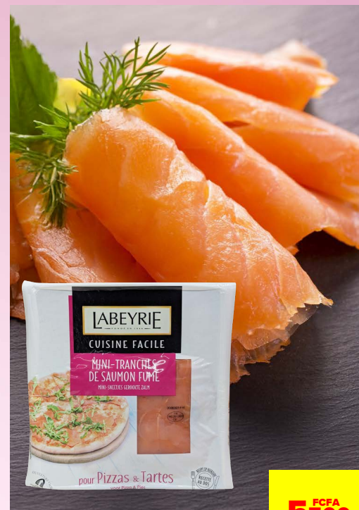
MINI-TRANCHES DE SAUMON FUMÉ 120G LABEYRIE